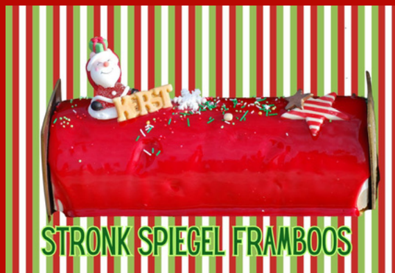
STRONK SPIEGEL FRAMBOOS